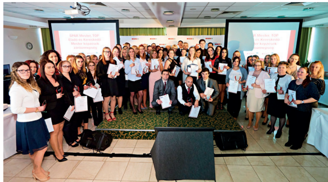
A SPAR Mester és Top Eladó képzés oklevelesei 2019.

2019-ben megújított szabályrendszerrel ismét elindult az idegen nyelvi képzés, amely során közel 200 kolléga kezdhette meg a nyelvtanulást.