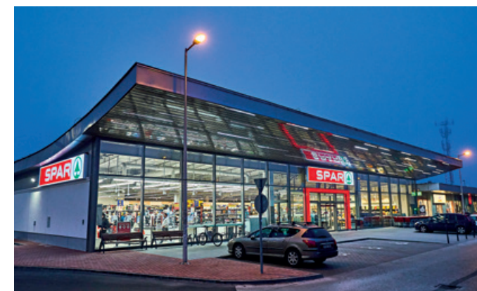
A megújult szántódi SPAR szupermarket

segítő önkiszolgáló kasszák mellett egy teraszos INTERSPAR to Go étterem, annak területén ingyenes wifi, salátabár és látványpékség várja a vásárlókat, a családok pedig a modern játszótérnek is örülhetnek. Az áruházban kiemelt helyre kerültek az egészségtudatos táplálkozást segítő, valamint a bio- és diabetikus élelmiszerek, illetőleg elérhető az áruházlánc saját márkás SPAR enjoy. convenience termékeinek teljes választéka is.